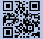
เว็บไซต์ บริษัท