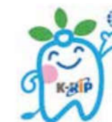
K-RIPイメージキャラクター「リッピーちゃん」

海外視察団の受け入れやASEAN地域等への調査チームやミッション団の派遣により、官民協議を実施することで、一社単独では難しい海外展開を強力に支援