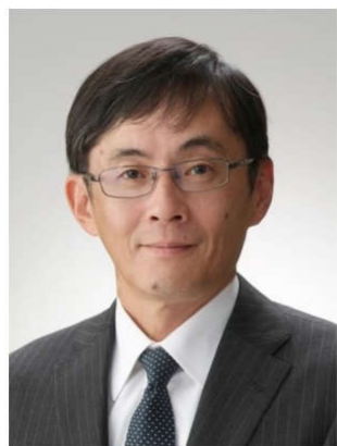
九州環境エネルギー産業推進機構