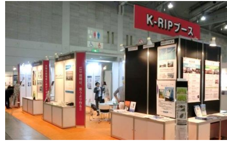
参考）近年のK-RIPブース例