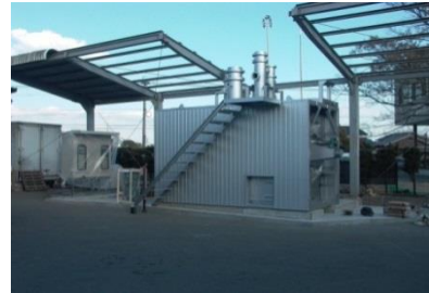
休止中の油化装置