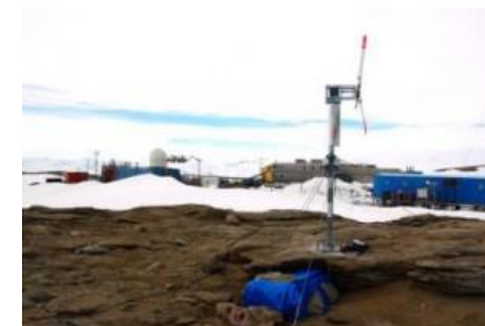
南極昭和基地に設置された風車

エコテクノ 2013 の出展応募 (K-RIP の支援メニュー) を希望され、8 月に入会されました。エネルギー関連設備の製作、施工をされています。主な製品は、創生バッテリー (不要となったバッテリーを再生)、風力、太陽光ハイブリッド街灯 (北九州市のエコプレミアム製品)、風車等です。希望どうりエコテクノ 2013 に採択、出展され、今月 13 日には、環境ビジネス交流会 (九経連との連携事業) で登壇されました。