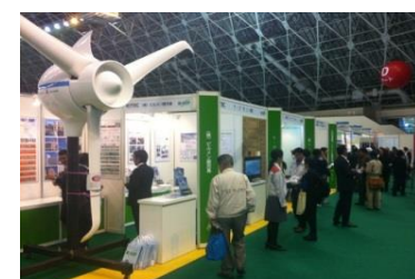
びわ湖環境ビジネスメッセ

秋の大型環境展示会、エコテクノ2013(10/16~18 北九州)とびわ湖環境ビジネスメッセ2013(10/24~26 滋賀)が開催されました。K-RIPの支援メニューを活用され、採択された会員企業さまが、マーケット拡大を目指して、製品展示やプレゼンテーションをされました。また、エコテクノの中日10/17には、ビジネスパートナーの発掘を目的に、地域間交流フォーラム(アライアンスマッチングセミナー)を開催し、プレゼン・個別商談を行いました。各社の今後の環境ビジネスに「つながりとひろがり」ができる事を期待します。