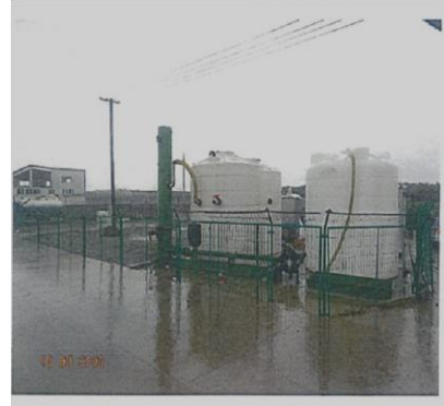
中国太湖での堆肥化装置

中国江蘇省無錫市は、悪臭で水道水を使用できない状況が発生しています。原因は、水源である太湖をペンキを塗ったような緑色に変色させている大量のアオコです。楽しい株式会社では、この問題解決に向けて、今年度の試行的事業の補助金を活用し、アオコの堆肥化（微生物分解で肥料を作る）システムの確立をめざしています。微生物を日本で増殖し中国にもちこむと、検査、検疫等で費用がかかるため、微生物の増殖は、中国で行っています。現在、堆肥化装置を太湖に設置し、アオコを堆肥化するのに、最も適した微生物を模索しています。中国では、同様の問題をかかえている地区が多くあり、成功させて中国で装置の普及拡大をめざします。