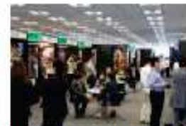
映画の国際見本市での商談風景