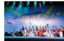
中国での日本アニメ紹介事業