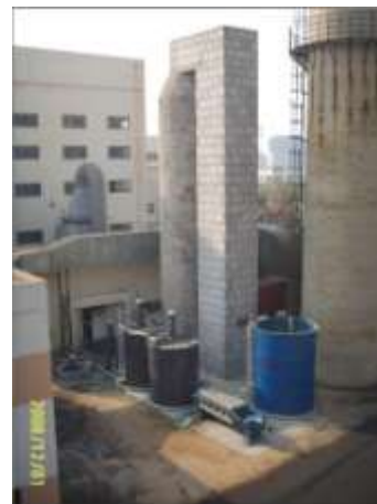
青島大学の脱硫装置