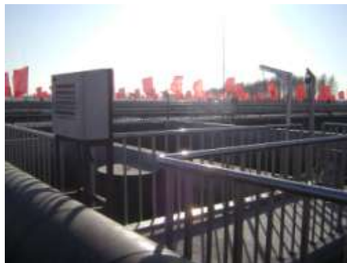
双城市 CASS 技術污水处理場