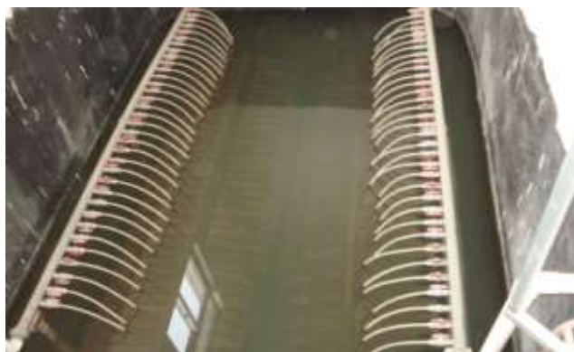
膜バイオリアクター